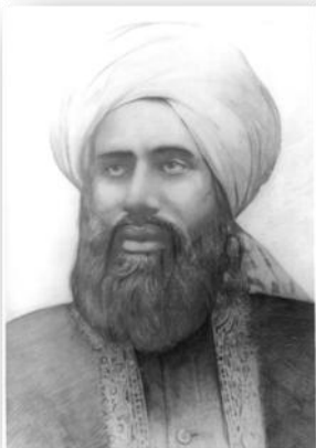
Хазрат Молви Нуруддин (Аллах да е доволен от него)