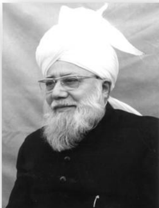
Хазрат Мирза Насир Ахмад (Аллах да го благослови)